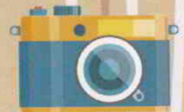
Un appareil photo