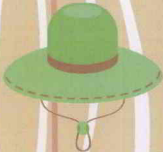
Une casquette ou un chapeau