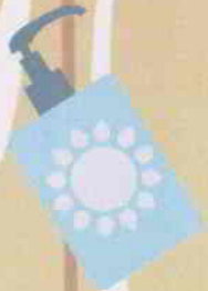
De la crème solaire adaptée à ta peau