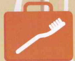
Trousse de toilette