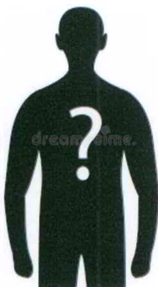
Animateur en cours de recherche