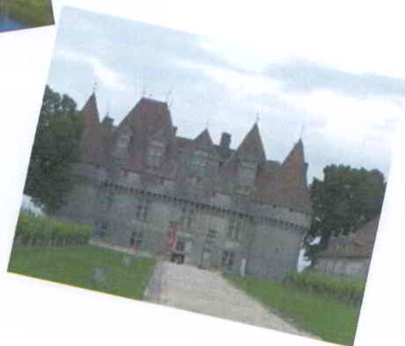
Le château de Monbazillac